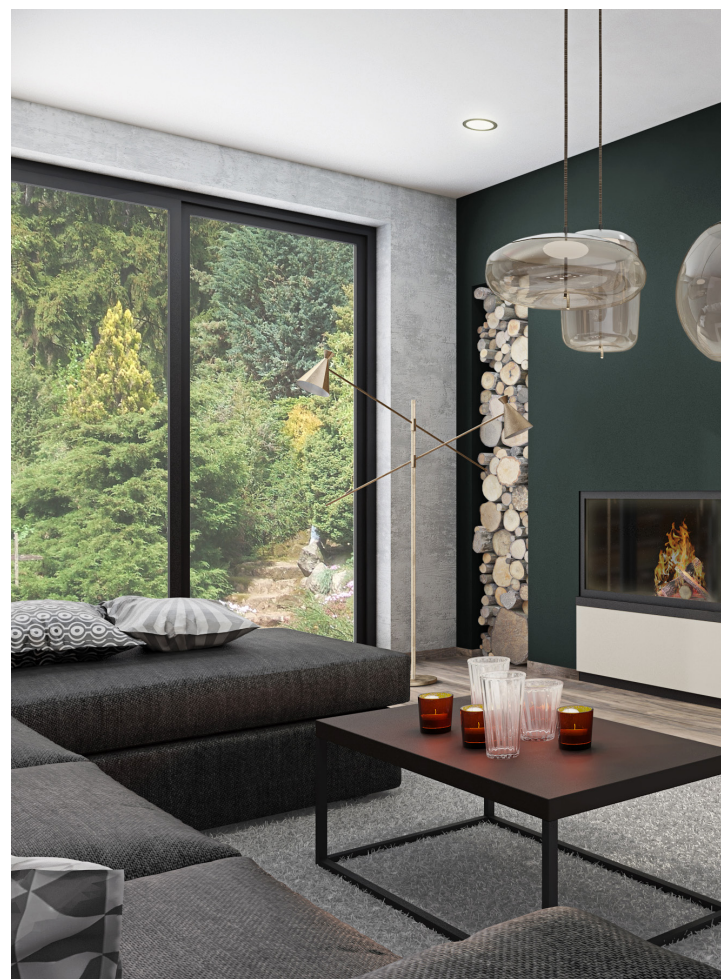
Kombinace dekorů P730+ černozeleň a P740+ šedoběžová